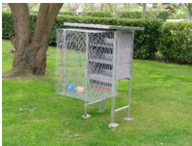
Volière 3 couples