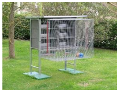
Volière 6 couples

Cher client, merci d'avoir acheté un produit FERRANTI.