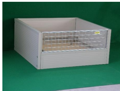
Caisse de mise à bas isolée

Cher client, merci d'avoir acheté un produit FERRANTI.