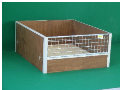
Caisse de mise à bas en bois