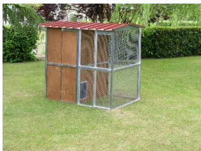
Box pour chats